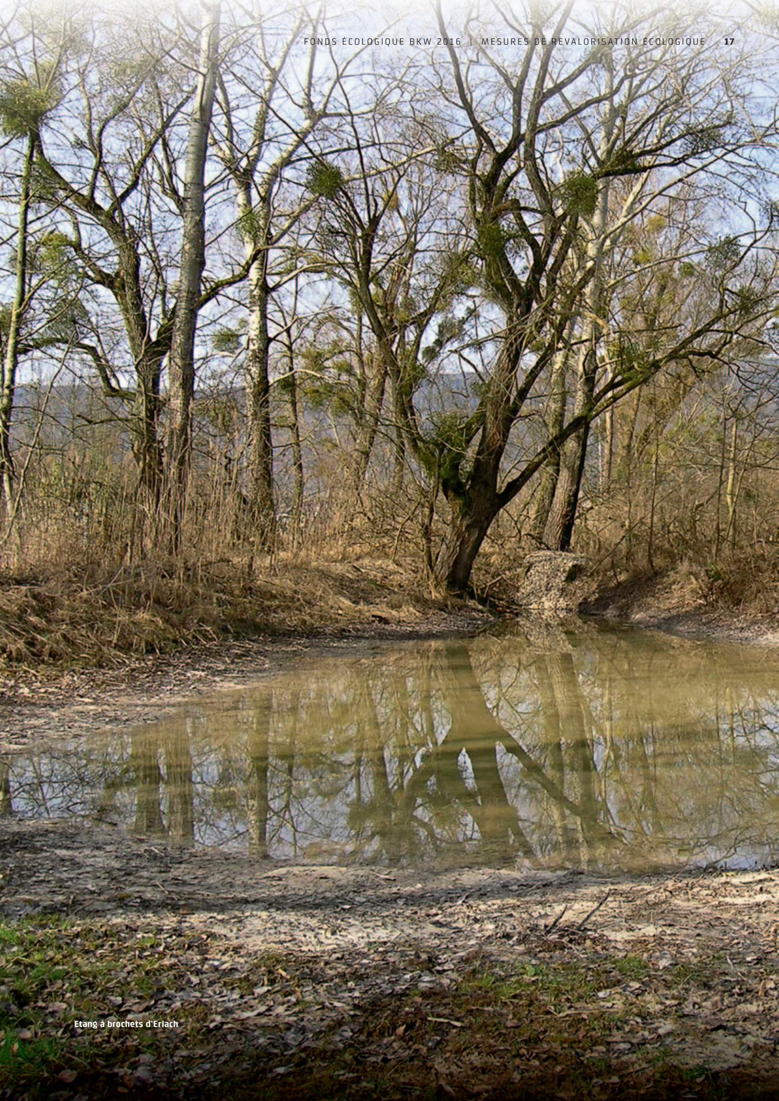
Etang à brochets d'Erlach