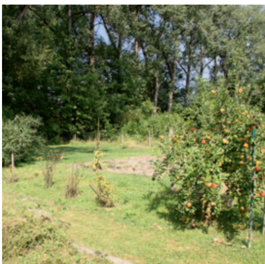
Photo de gauche: la Vieille Aar, Lyss, d'anciens jardins transfor- més en habitats alluviaux typiques